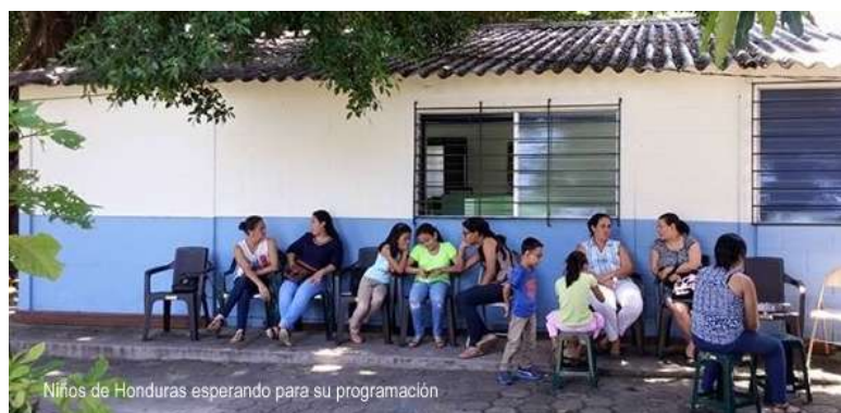
Niños de Honduras esperando para su programación

Completó su eficaz intervención con varias charlas con las profesoras y logopedas de dicho centro educativo, perfeccionando sus conocimientos en torno al implante coclear y la atención especializada a sus usuarios.